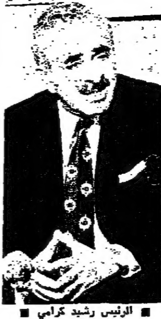
الرئيس رشيد كرامي

تنسيق المواقف مع المقاومة امضى الرئيس كرامي وقته قبل ظهر امس في وزارة الدفاع، مع قائد الجيش العماد غانم وضباط القيادة، في جلسة تطورات الاعتداءات الاسرائيلية على لبنان، بعد استهزاء الضباط الوريثة في صور. وقد وصل الرئيس كرامي الى الوزارة في الساعة العاشرة حيث كان في استقباله قائد الجيش، وعقد على الفور اجتماع ضم كبار الضباط، جرى خلاله عرض تفاصيل الاعتداء الاسرائيلي على صور، والتدابير المتخذة لمواجهة